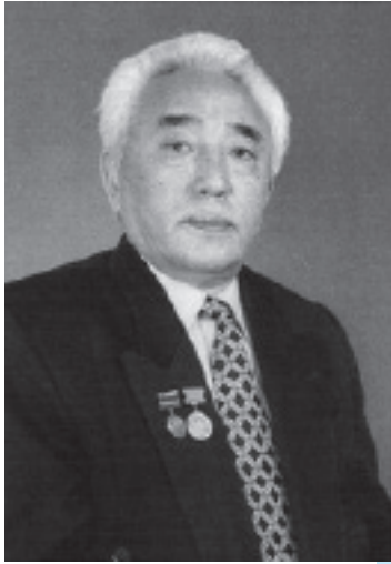
Қабдеш ЖҰМАДІЛОВ Халық жазушысы, Мемлекеттік сыйлықтың лауреаты